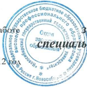
График учебного процесса заочного отделения ИФМИП специальности «Менеджмент организации», «Управление персоналом» на 2012 / 2013 учебный год